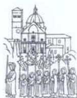
Cattedrale di San Rufino